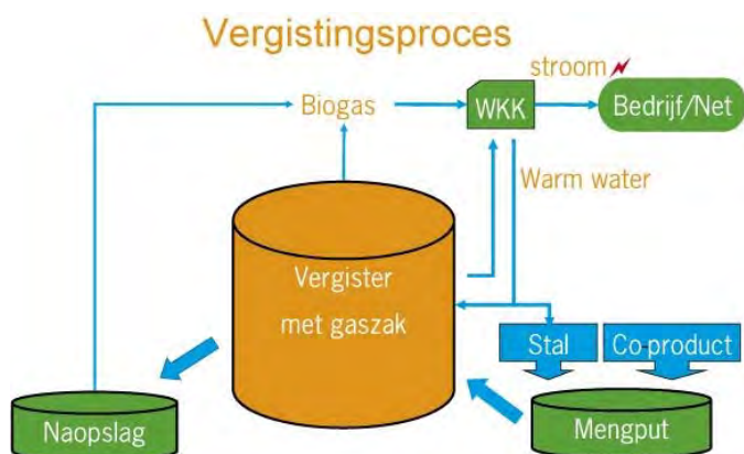
Figuur 1: Vergistingsproces

Door het vergistingsproces is een deel van de organisch gebonden stikstof omgezet in minerale stikstof. Daardoor is de stikstof in de mest sneller opneembaar voor de plant. Daarmee lijkt het meer op kunstmest en kan het tevens een besparing in het kunstmestgebruik geven.